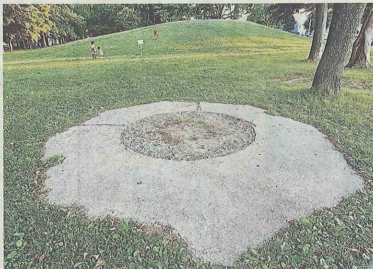
高射砲の台座跡(手前)が残る美香保公園。みかほ山(後方)の下にも大きな台座が眠る。札幌市東区で

違ったと思うと、びっくた地権者の宮村、柏野、大塚の3氏が区画中心部に公園を整備し、3人の頭文字を取って「ミカオ公園」と命名。その後、住民の呼称が「ミカホ山」に変化し、41年に札幌市和3)年、区画整理をしに寄贈後、現在の漢字が