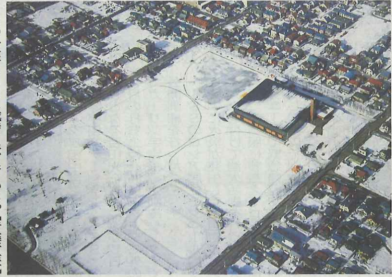
札幌五輪開催時の美香保公園。右上が北方方向で、最北部の建物が美香保体育館—札幌市東区で1972年2月

メモ コンクリートの高射砲台座跡と「みかほ山」所在地—札幌市東区北21東4。美香保公園西側のB野球場の右翼フェンス脇にある。公園は地下鉄南北線北24条駅の3番出口から徒歩10分。問い合わせは公園指定管理者「北のふるさとNグループ」(011・789・4361)。